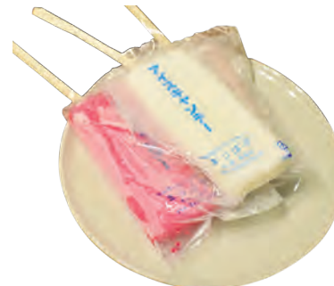
↑キャンデー/100円…昔ながらのアイスキャンデー。割り箸がささってます。