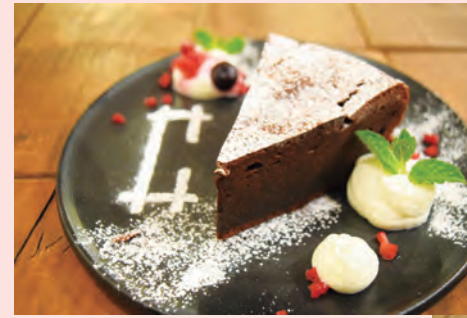
↑ガトーショコラ/480円(学割380円)…鉄板の人気メニュー。 中島村産鶏卵でできた生地深い味わい。

住所 福島県白河市桜町82-1 電話 0248-21-8515 営業時間 08:00~18:00 定休日 月曜日