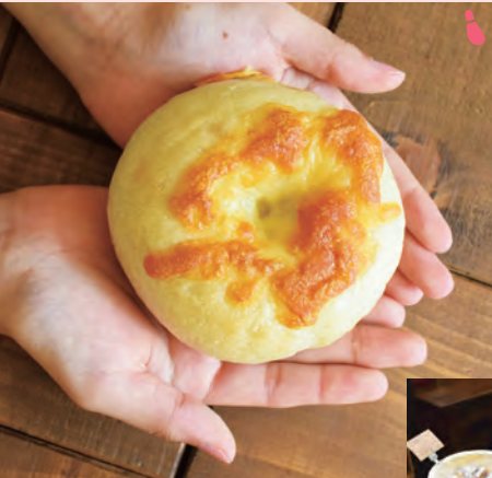
↑3種チーズのベーグル/180円…ふりかけられたチーズと、 生地に練りこまれたチーズのハーモニー！