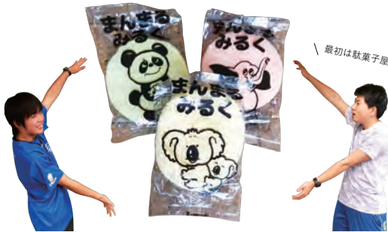
↑まんまるみるく/22円…本当は水あめを塗って食べる。けど、食べ方はあなた次第…