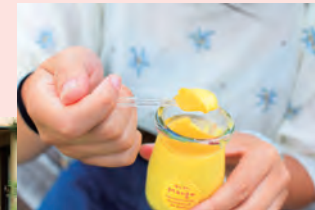
←プリン/232円…まるやか。口溶け がすごい。開けた瞬間マンゴー 香る、マンゴー味も！