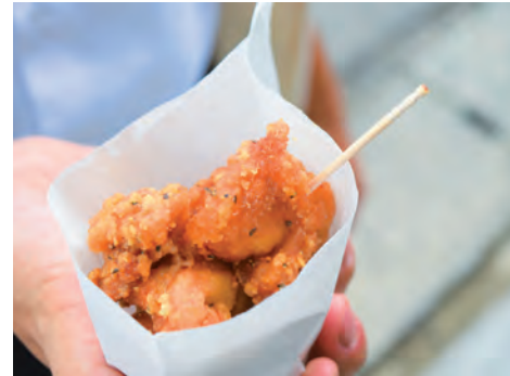
↑からあげ/3個 100円…いつでもできたあつあつの唐揚げ。胡椒がきいた味が癖になる。